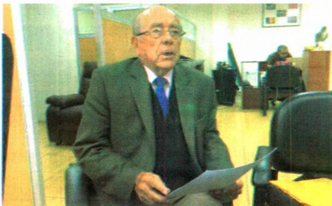
PRETEL RADA. Denunció la presunta adulteración ante la 12 Fiscalía Provincial de Lima.

El proyecto -inicialmente- aceptaba el criterio valorista, es decir, actualizar la deuda basándose en el Índice de Precios al Consumidor (IPC). De este modo, se tomaría en cuenta, por ejemplo, los productos de la canasta familiar como referencia para saber el monto